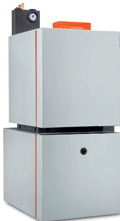
Configuration Vitoladens 300-C avec préparateur d'eau chaude sanitaire inférieur Vitocell

Certificats d'économies d'énergie Opération N° BAR-TH-106