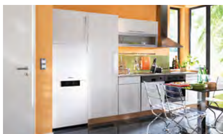
Chaudière compacte au sol Vitodens 222-F