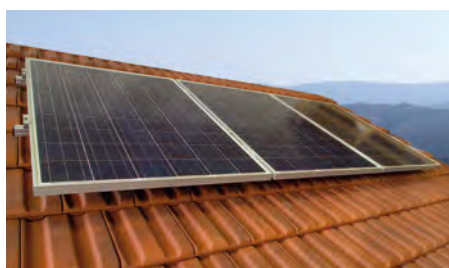
L'ensemble comprend de 1 à 4 modules photovoltaïques